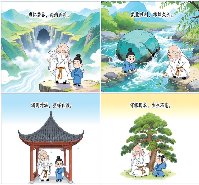
虚若谷,海纳百川。柔能胜刚,绵绵久长。满则外溢,空杯自盈。守根固本,生生不息。